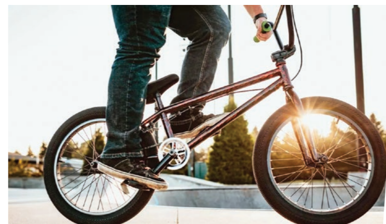
Elindítottuk a BMX Freestyle pálya közbeszerzését. A beruházás az Aktív Magyarország Program 40 millió Ft-os támogatásával valósul meg.