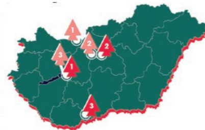
7. táblázat A legdinamikusabban fejlődő 15 000 fő feletti városok az Egyensúly Intézet településindexe alapján