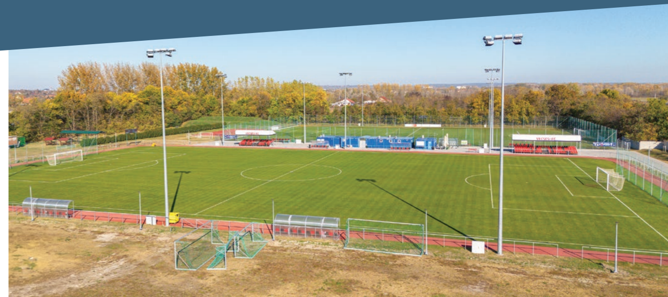
A Sportcentrumba új konténer-öltöző és közösségi egységek kerültek.