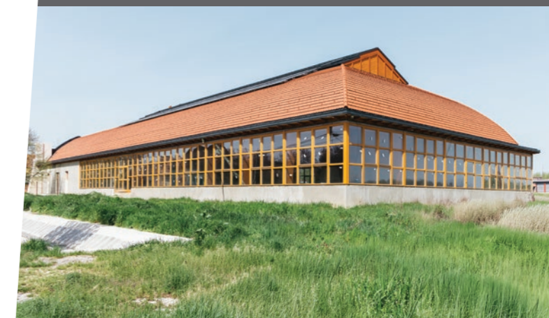
2025-ben az állami beruházásban és kivitelezésben megvalósuló tanuszoda építése is folytatódott.