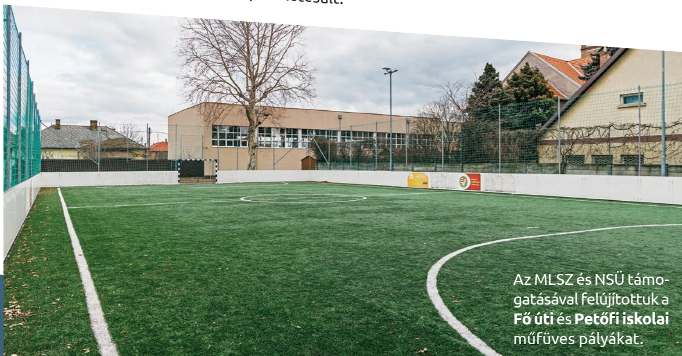
Az MLSZ és NSÜ támogatásával felújítottuk a Fő úti és Petőfi iskolai műfüves pályákat.