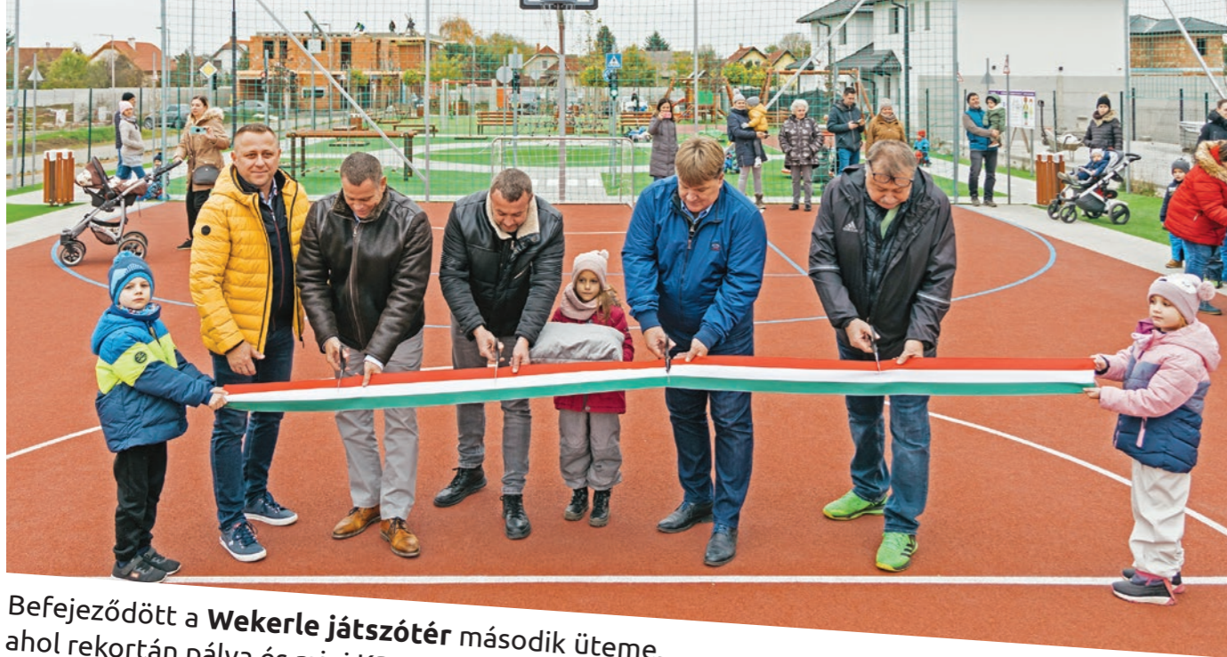
Befejeződött a Wekerle játszótér második üteme, ahol rekortán pálya és mini KRESZ-park létesült.