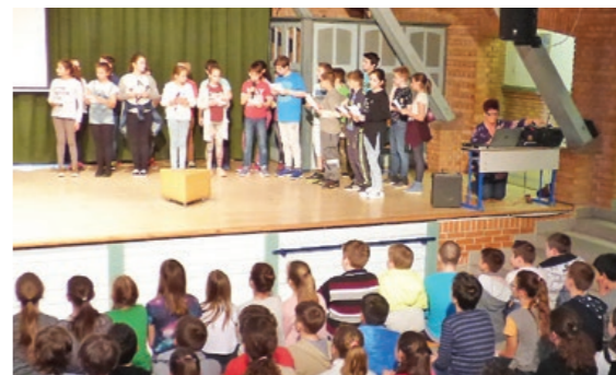
Felső tagozatos diákok előadása