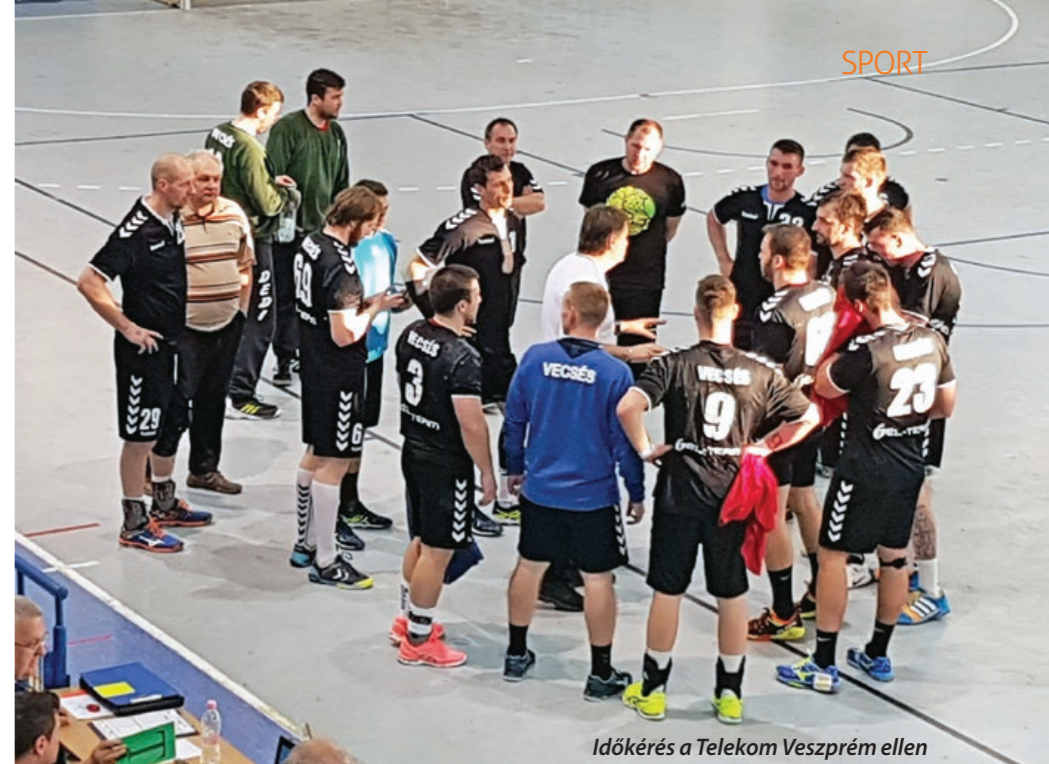
Időkerés a Telekom Veszprém ellen