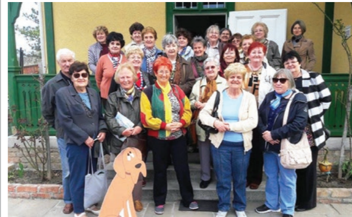
Gyáli nyugdíjas pedagógusok Vecsésen