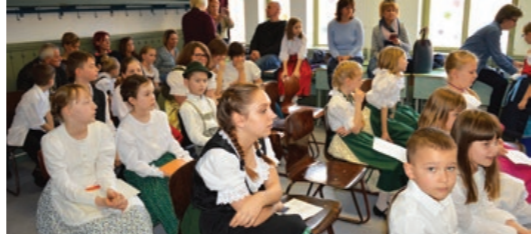
Így izgultak egymásért a versenyzők

A tanulók 2017. április 6-án, Újhartyánban a megyei versenyen folytathatják a megmérettést. Iskolánk tanulói közül idén is sokan továbbjutottak, bízunk a sikeres folytatásban. Gratulálunk mindenkinek és további szép eredményeket kívánunk!