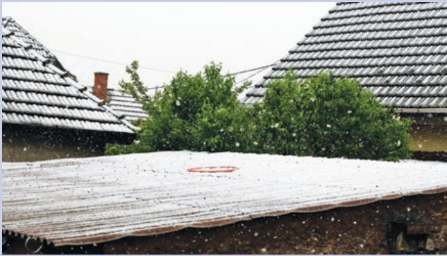
Tél a tavaszban