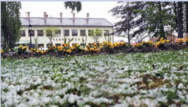
Április 19-én Vecsésen is hó borította az utcákat. Így nézett ki a Szent István tér.