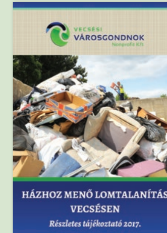
HÁZHOZ MENŐ LOMTALANÍTÁS VECSESEN Részletes tájékoztató 2017.

1 A régi módszer szerint egy évben egyetlen adott időponthoz kellett mindenkinek igazodni. Akinek nem felelt meg a kijelölt lomtalanítás nap, kénytelen volt várni egy évet vagy keresni és megfizetni azt a szolgáltatót, aki a hához menő lomtalanítást különdíj ellenében elvégezte.