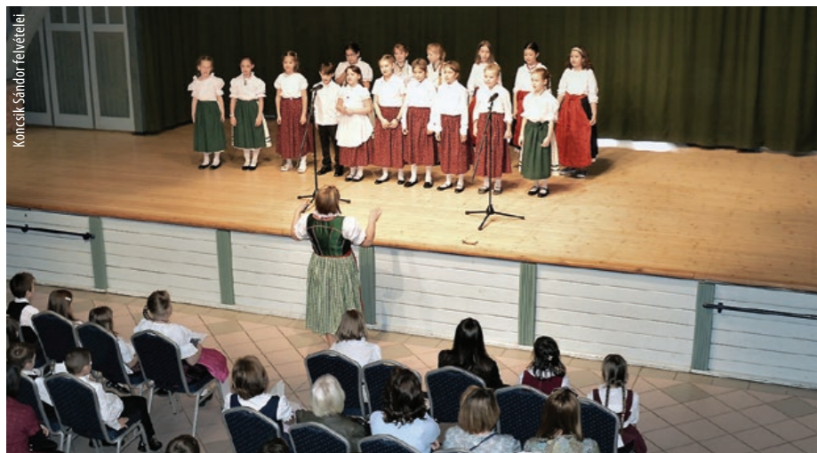
Köncsik Sándor felvételei

A Magyarországi Németek Országos Önkormányzata, valamint az Észak-Magyarországi Német Önkormányzatok Szövetsége (ÉMNÖSZ) által meghirdetett és támogatott vers- és prózamonddó verseny egyik elődöntőjét rendeztük meg iskolánkban.